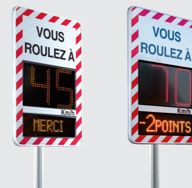
Exemple de configurations et de décors possibles

UNE VÉRITABLE SOLUTION POUR COMBATTRE LES EXCÈS DE VITESSE !