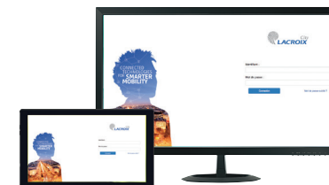
Plateforme web LX Connect Fonctions Tegis Astroconnect (voir p : 56-59)