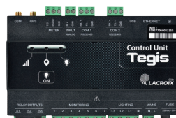
Unité de contrôle Tegis Astroconnect (voir p : 50-51)