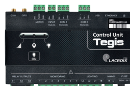
Unité de contrôle Tegis Astro (voir p : 50-51)